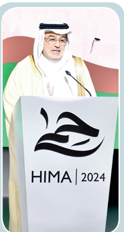
د.محمد قربان الرئيس التنفيذي للمركز الوطني لتنمية الحياة الفطرية

يشارك فيه عدد من المؤسسات التعليمية والمشاريع الكبرى والشركات والقطاع غير الربحي.