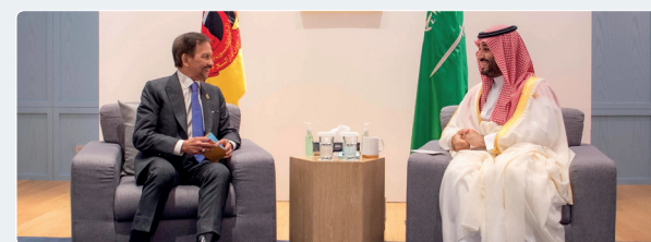
ولي العهد يبحث مع جلالة السلطان الحاج حسن البلقية، سلطان بروناي دار السلام مجالات التعاون.