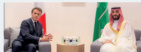
ولي العهد يستعرض مع رئيس فرنسا إيمانويل ماكرون آفاق التعاون الثنائي.