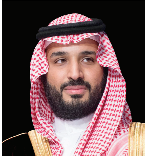
اطراد التقدم والازدهار.

• الرياض - واس بعث خادم الحرمين الشريفين الملك سلمان بن عبدالعزيز آل سعود، برقية تهنئة لفخامة الرئيس روك مارك كريستيان كابوري رئيس بوركينا فاسو، بمناسبة ذكرى استقلال بلاده. وأعرب الملك المفدى باسمه واسم شعب وحكومة المملكة العربية السعودية عن أصدق التهاني وأطيب التمنيات بالصحة والسعادة لفخامته، ولحكومة وشعب بوركينا فاسو الشقيق، اطراد التقدم والازدهار. وبعث حفظه الله، برقية تهنئة لفخامة الرئيس الحسن وانارا رئيس جمهورية كوت ديفوار، بمناسبة ذكرى استقلال بلاده. وعبر سمو ولي العهد، عن أطيب التهاني وأصدق التمنيات بموفق الصحة والسعادة لفخامته، راجياً لحكومة وشعب جمهورية كوت ديفوار الشقيق، المزيد من التقدم والازدهار. وبعث أيده الله، برقية تهنئة لفخامة السيدة حليلة يعقوب رئيسة جمهورية سنغافورة، بمناسبة ذكرى اليوم الوطني لبلادها. وعبر سمو ولي العهد عن أطيب التهاني وأصدق التمنيات بموفق الصحة والسعادة لفخامتها، راجياً لحكومة وشعب جمهورية سنغافورة الصديق، المزيد من التقدم والازدهار. وبعث حفظه الله، برقية تهنئة لفخامة مشير تشاد إدريس ديبي إتنو رئيس الجمهورية ورأس الدولة في جمهورية تشاد، بمناسبة ذكرى استقلال بلاده. وعبر سمو ولي العهد، عن أطيب التهاني وأصدق التمنيات بموفق الصحة والسعادة لفخامته، راجياً لحكومة وشعب جمهورية تشاد الشقيق، المزيد من التقدم والازدهار.