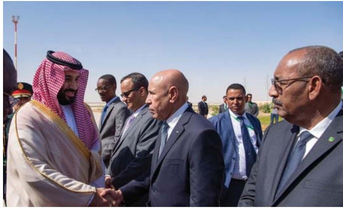
الرئيسي في العاصمة نواكشوط.

ولي العهد الدكتور بندر الرشيد، ومعاي نائب رئيس المراسم الملكية الأستاذ رakan الطيبشي، وسفير خادم الحرمين الشريفين لدى موريتانيا الدكتور هزاع المطيري.