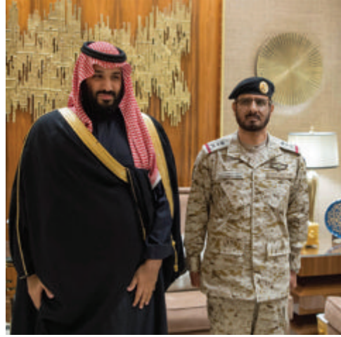
الركن فهد بن عبدالله المطير، بمناسبة ترقيته وتعيينه قائداً للقوات البرية، والفريق الركن مزيد بن سليمان العمرو،