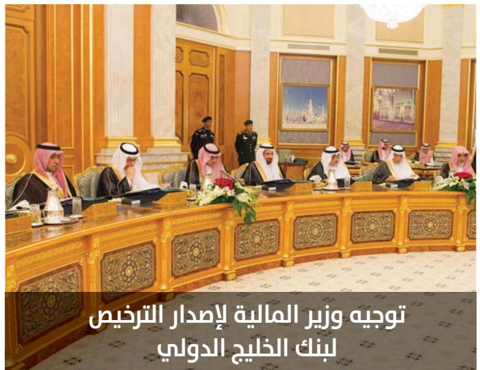
توجيه وزير المالية لإصدار الترخيص لبنك الخليج الدولي

أولاً: وافق مجلس الوزراء على تفويض معالي وزير الخارجية أو