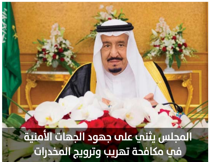
المجلس يشي على جهود الجهات الأمنية في مكافحة تهريب المخدرات