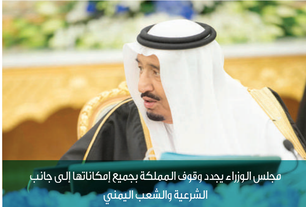
مجلس الوزراء يحدد وقوف المملكة بجميع إمكاناتها إلى جانب الشرعية والشعب اليمني

وأوضح معالي وزير الثقافة والإعلام الدكتور عادل بن زيد الطريفي، في بيانه لوكالة الأنباء السعودية، عقب الجلسة، أن مجلس الوزراء ناقش بعد ذلك جملة من الموضوعات في الشأن المحلي، كما استمع إلى عدد من التقارير عن مجريات الأحداث على الساحات العربية والإقليمية والدولية، منوهاً بنتائج اجتماع صاحب السمو الملكي الأمير محمد بن نايف بن عبدالعزيز، ولي ولي العهد النائب الثاني لرئيس مجلس الوزراء وزير الداخلية، مع صاحب السمو الملكي الأمير سلمان بن حمد آل خليفة، وصاحب السمو الشيخ محمد بن زايد آل نهيان، ومعالي الشيخ عبدالله بن ناصر آل ثاني، ومعالي الشيخ محمد الخالد الصباح، وما جرى خلاله من تأكيد على المواقف الداعمة للشريعة في الجمهورية اليمنية ممثلة في فخامة الرئيس عبدربه منصور هادي، وللشعب اليمني الشقيق، واستعداد دول مجلس التعاون لدول الخليج العربية لبذل الجهود كافة لدعم أمن اليمن واستقراره. وجدد مجلس الوزراء في هذا السياق وقوف المملكة إلى جانب الشريعة والشعب اليمني بامكاناتها كافة، وتأكيداً على أهمية الاستجابة العاجلة من قبل كل الأطياف السياسية في اليمن الراغبين في المحافظة على أمن واستقرار اليمن للمشاركة في المؤتمر الذي سيتم عقده تحت مظلة مجلس التعاون في مدينة الرياض، وإدانتها لجميع الاعتداءات والتفجيرات الإرهابية التي لن تؤدي إلا إلى المزيد من زعزعة الأمن والاستقرار في الجمهورية اليمنية وتعرض أبنائها إلى الفتنة والتدمير. وبين معاليه أن مجلس الوزراء جدد إدانة المملكة العربية السعودية للهجوم الإرهابي المسلح الذي استهدف متحف باردو في تونس العاصمة، وأودى بحياة العديد من الضحايا