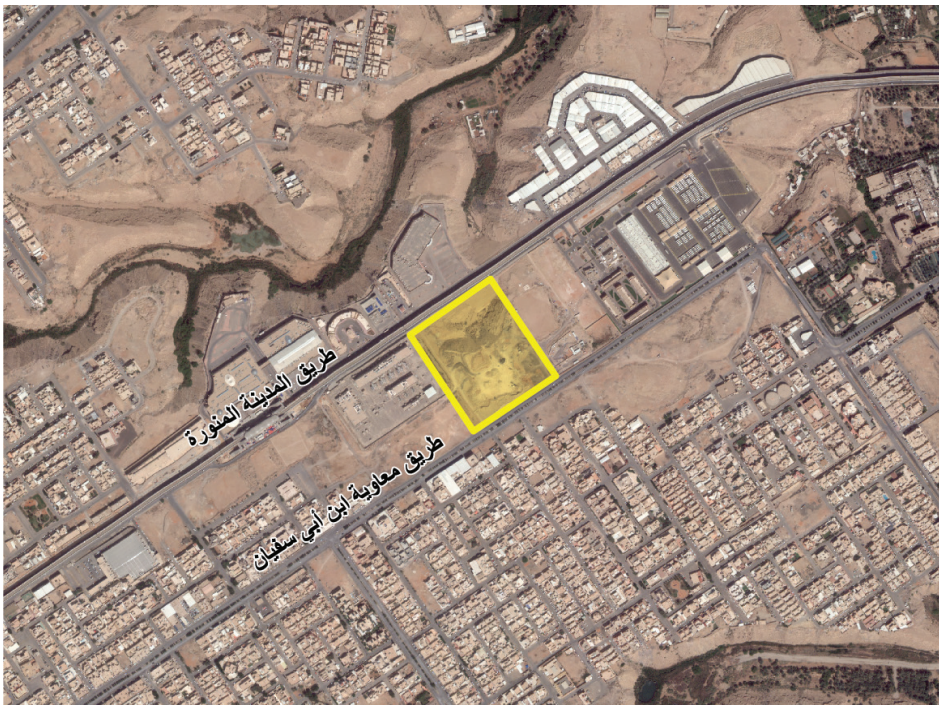
حي ظهرة البديعة

وللاستفسارات، يُرجى التواصل على الرقم: 0118021234