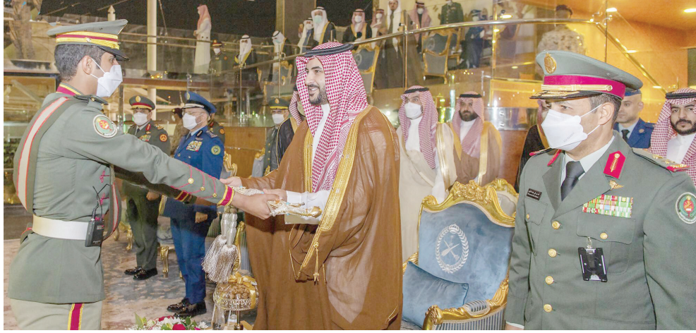
اللواء الركن محمد بن مشيب القحطاني. قائد كلية الملك عبد الله للدفاع الجوي اللواء الركن محمد بن علي البلوي كلمة ثمن فيها رعاية سمو نائب وزير الدفاع لحفل تخريج الدفعة (١٩)، ودورة تأهيل الضباط

بعد ذلك جرى العرض العسكري، وأدى الخريجون القسم، ثم أعلنت النتائج، وكرم سموه الطلبة المتفوقين من الدفعة، كما تسلّم سمو نائب وزير الدفاع هدية تذكارية من قائد كلية الملك عبد الله للدفاع الجوي. وفي ختام الحفل التقطت الصور التذكارية، ثم عزف السلام الملكي.